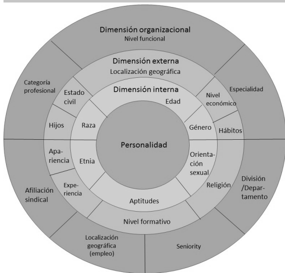
FIGURA 1 THE FOUR LAYERS MODEL