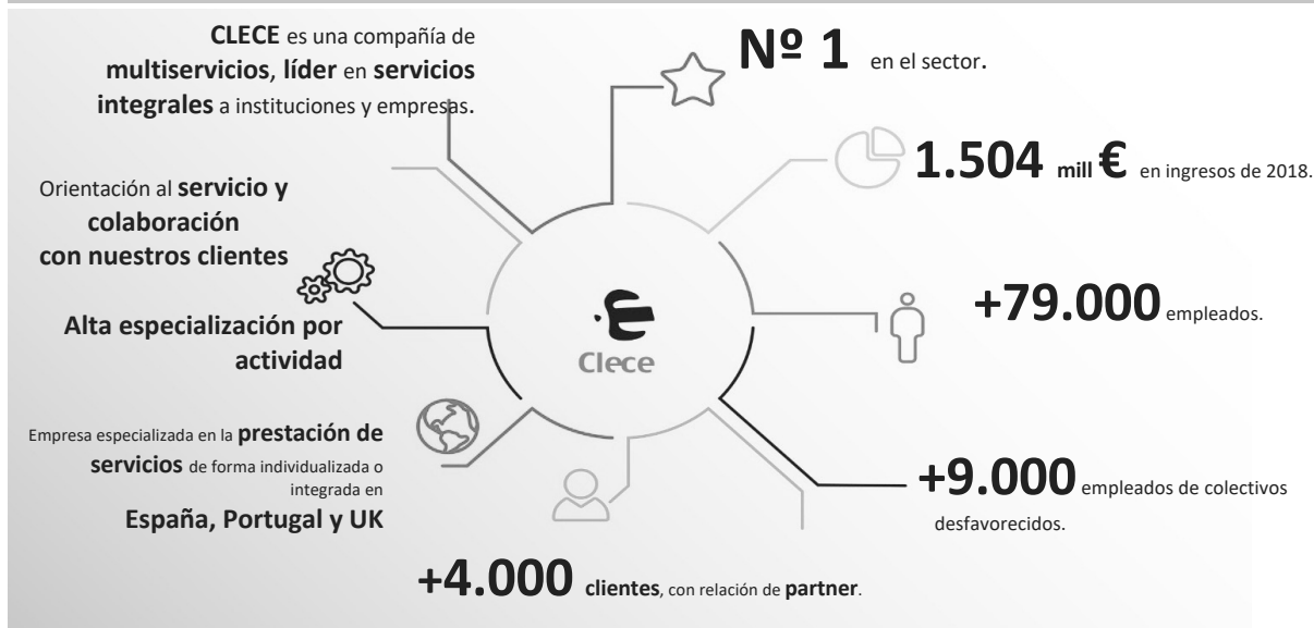
FIGURA 5 CLECE EN ALGUNAS CIFRAS Y DATOS